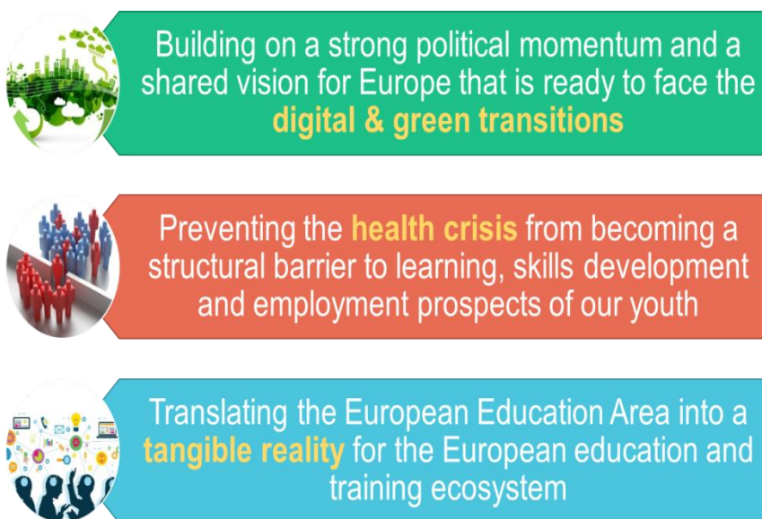
Immagine: realizzare lo spazio europeo dell'istruzione

L'adozione del nuovo piano d'azione per l'istruzione digitale 13 sostiene l'impiego delle tecnologie digitali necessarie per l'istruzione e la formazione e mira a dotare tutti i cittadini di competenze digitali. Nell'agosto 2021 la Commissione ha proposto una raccomandazione del Consiglio relativa all'apprendimento misto per meglio sostenere le scuole e i discenti interessati dal passaggio al digitale provocato dalla pandemia, fra l'altro tramite ulteriori opportunità di apprendimento e sostegno mirato ai discenti con difficoltà di apprendimento 14 .