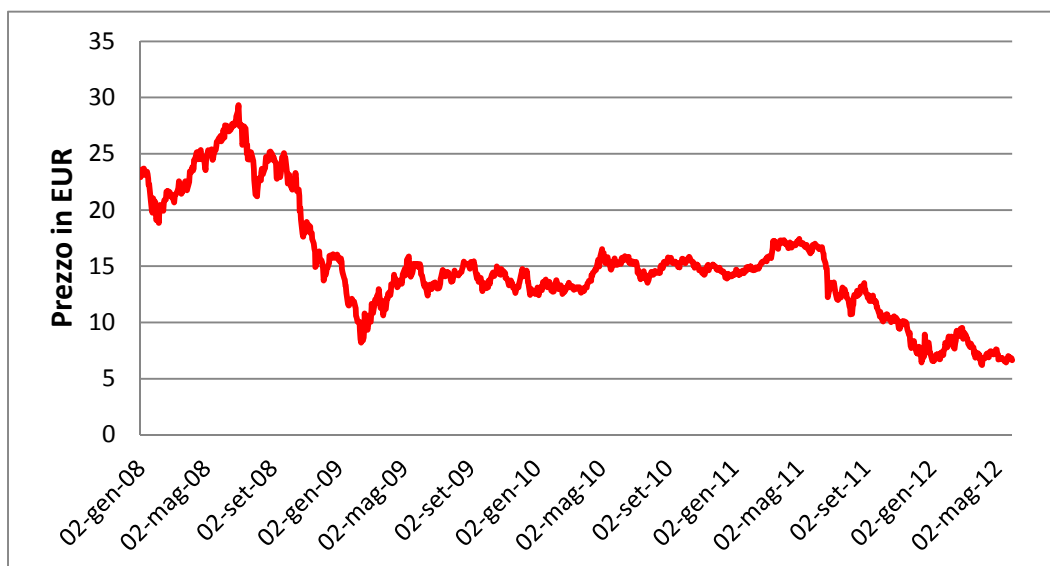
Figura 1: Andamento del prezzo del carbonio

Dati relativi a contratti a termine ( futures ) per l'anno precedente con consegna a dicembre