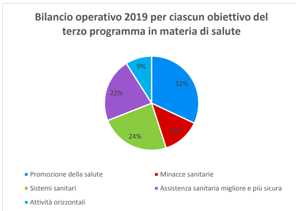
Grafico 1: bilancio operativo 2019 per ciascun obiettivo del terzo programma in materia di salute

Per quanto riguarda la dotazione di bilancio 2019 per ciascuna delle priorità tematiche del programma, il grafico 2 mostra che alle attività nell'ambito della priorità tematica 1 volte a promuovere la salute, prevenire le malattie e incoraggiare ambienti favorevoli a stili di vita sani è stato assegnato l'importo più elevato, seguito dalle dotazioni per la vaccinazione, i dispositivi medici e le malattie rare.