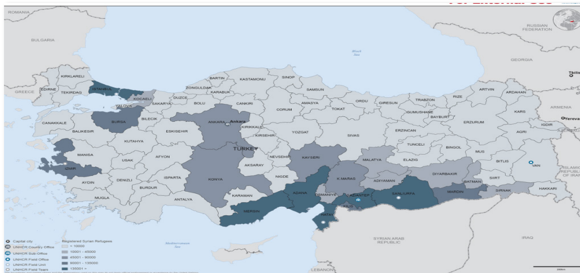
Ripartizione per provincia dei rifugiati siriani in Turchia.

Data la sua posizione geografica, la Turchia è un importante paese di accoglienza e di transito per molti rifugiati e migranti. A seguito di un afflusso senza precedenti, dovuto soprattutto al conflitto in Siria, il paese ospita il numero di rifugiati e migranti più alto al mondo: oltre 3 milioni. Di questi, 2,8 milioni sono rifugiati siriani registrati, il 10% dei quali vive in 26 campi creati dal governo turco nel sud-est del paese, mentre il restante 90% vive fuori dai campi in zone urbane, periurbane e rurali. Per accogliere e ospitare un numero così alto di rifugiati e migranti, la Turchia sta fornendo un generoso sostegno umanitario e finanziario.