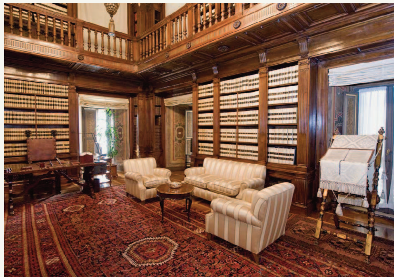
PALAZZO GIUSTINIANI SALA DELLA COSTITUZIONE

Con questa pubblicazione il Senato della Repubblica intende promuovere la conoscenza della Costituzione italiana da parte dei cittadini, rendendo loro accessibile – articolo per articolo – non solo il testo vigente della Carta fondamentale, ma anche il progetto originariamente predisposto dalla Commissione dei Settantacinque, gli emendamenti a esso presentati, il testo approvato dall'Assemblea Costituente e infine gli estremi delle leggi di revisione costituzionale successivamente intervenute.