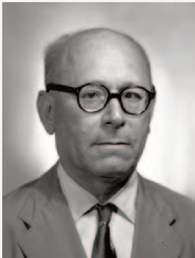
UMBERTO TERRACINI PRESIDENTE DELL'ASSEMBLEA COSTITUENTE

RESOCONTO DELLA SEDUTA POMERIDIANA DELL'ASSEMBLEA COSTITUENTE DEL 22 DICEMBRE 1947