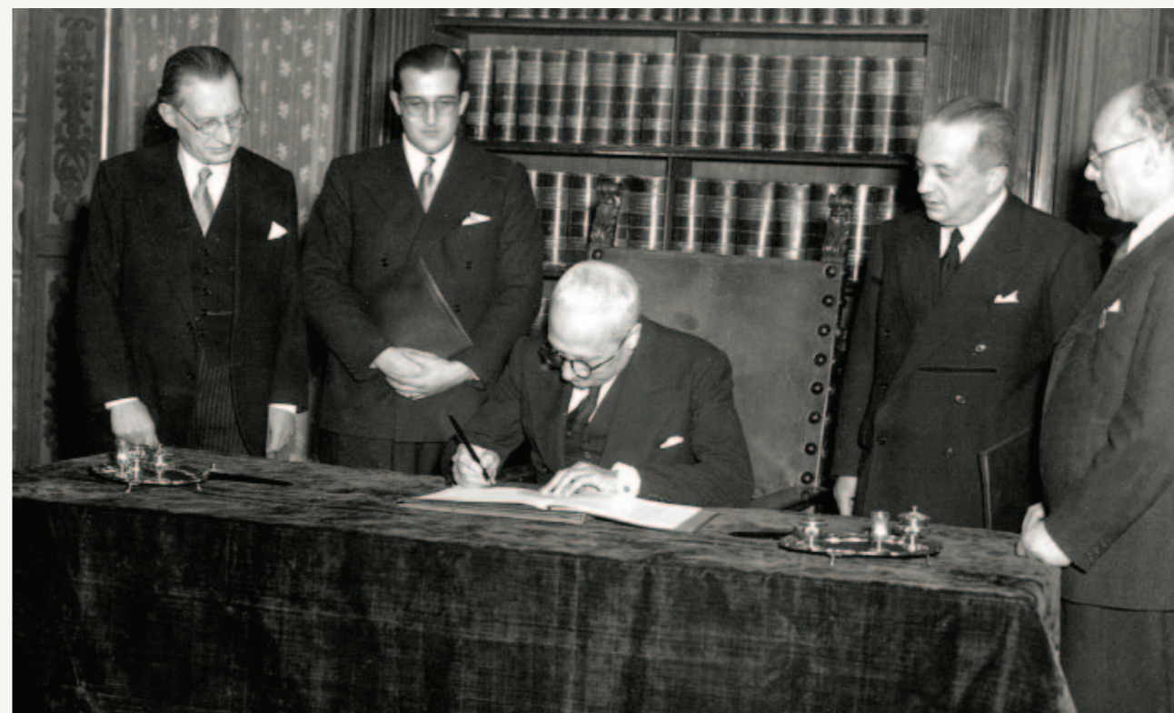
ENRICO DE NICOLA FIRMA LA CARTA COSTITUZIONALE IL 27 DICEMBRE 1947