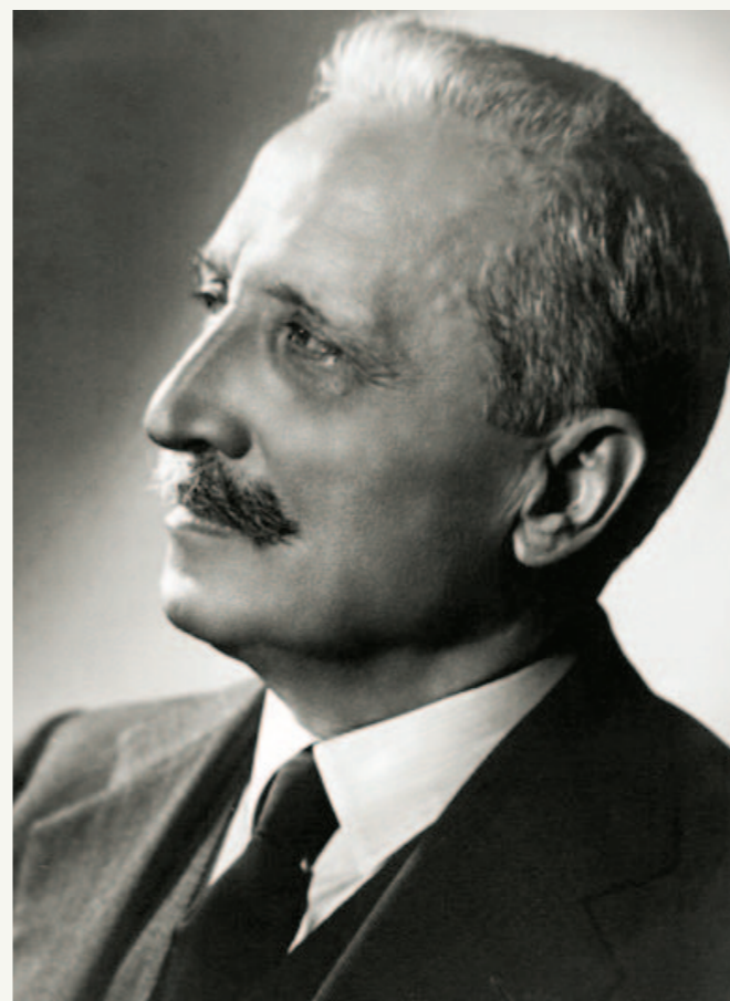
ENRICO DE NICOLA