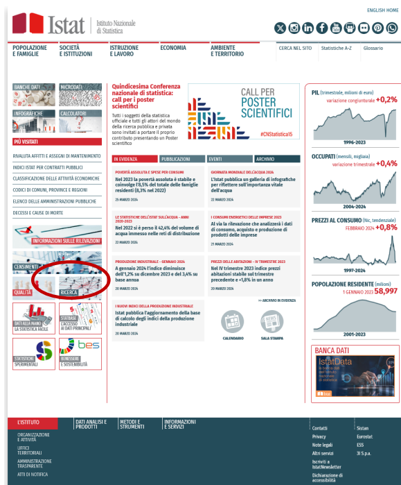
Figura 1 - Home page sito istituzionale Istat

Obiettivo principale della sezione in parola è quello di mettere a disposizione dei ricercatori nazionali e internazionali gli strumenti e i risultati raggiunti attraverso le attività di ricerca descritte e inserite nel contesto normativo di riferimento.