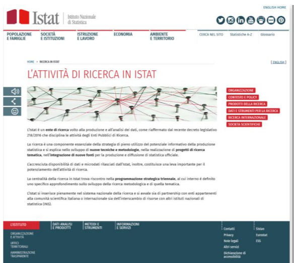
Figura 2 – Sezione web dedicata ad Attività di ricerca sito istituzionale Istat

Obiettivo principale della sezione in parola è quello di mettere a disposizione dei ricercatori nazionali e internazionali gli strumenti e i risultati raggiunti attraverso le attività di ricerca descritte e inserite nel contesto normativo di riferimento.