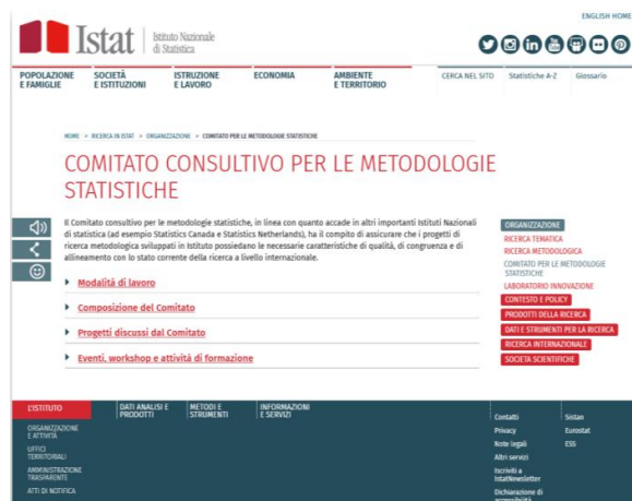
Figura 4 – Pagina Comitato consultivo per le metodologie statistiche su sito istituzionale Istat

Per quel che riguarda la pagina Comitato consultivo per le metodologie statistiche all'interno della sezione Organizzazione sono esplicitate: Modalità di lavoro, Composizione del Comitato, Progetti discussi dal Comitato e Eventi, workshop e attività di formazione.