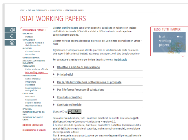
Figura 6 – Pagina Istat Working Papers su sito istituzionale Istat

Al fine di sviluppare ulteriormente la diffusione degli Istat Working Papers , nel corso del 2023 è stata rilasciata la nuova area del sito web istituzionale dedicata a questa collana, dove sono resi disponibili tutti i lavori (circa 150 a partire da gennaio 2011), che si possono consultare e scaricare in modo aperto e completamente gratuito: https://www.istat.it/it/dati-analisi-e-prodotti/pubblicazioni/istat-working-papers .