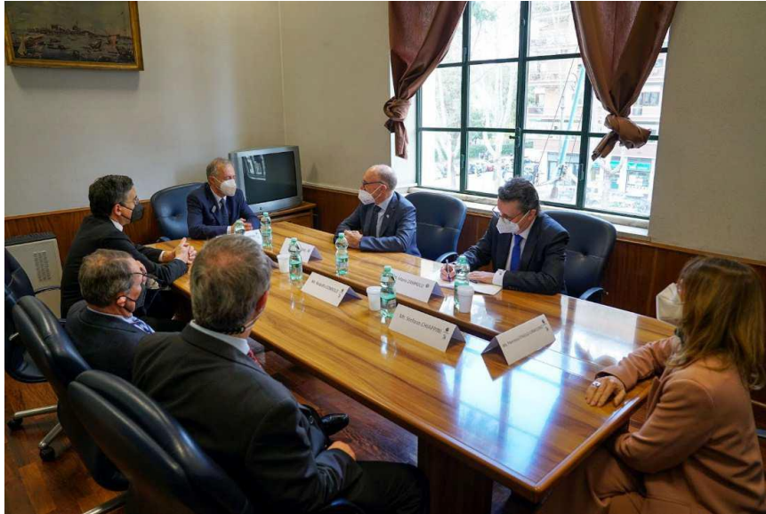
Visita del Segretario Esecutivo presso la sede dell'NDC italiano