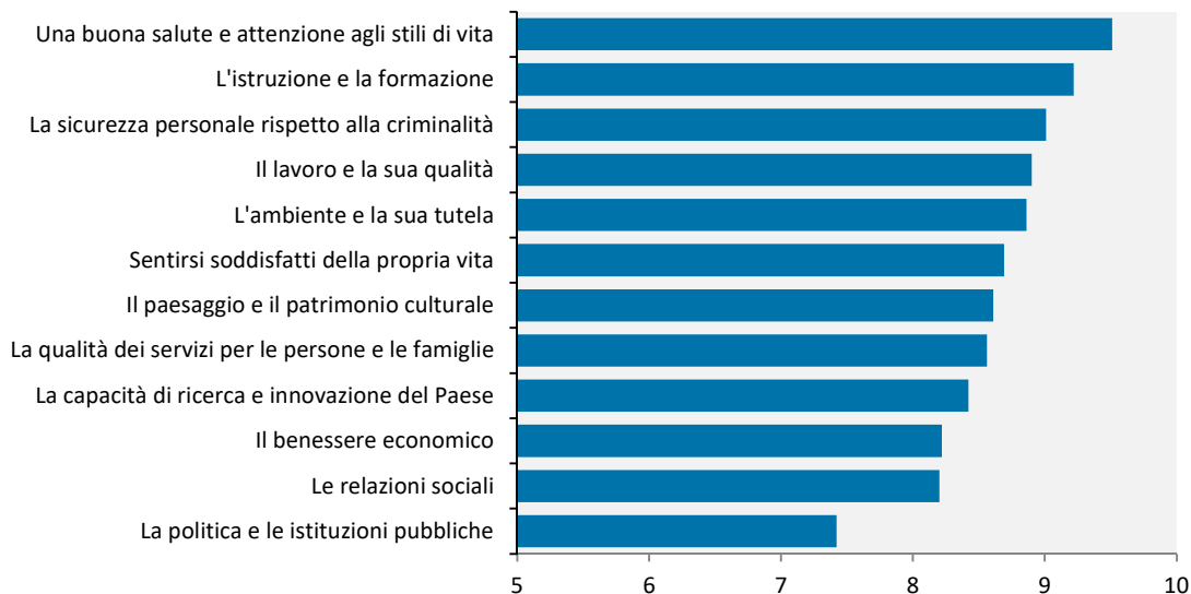
Figura 1 - Punteggio medio attribuito ai domini del benessere equo e sostenibile (voti tra 0 e 10) Anno 2018 (persone di 18 anni e più)