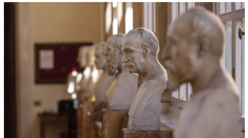
Busti di personalità della storia politica e istituzionale italiana nel cortile e negli interni di Palazzo Madama