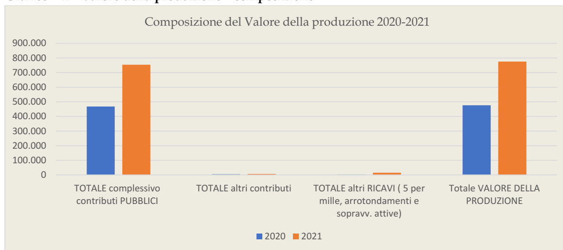
Grafico - 1 - Valore della produzione - composizione