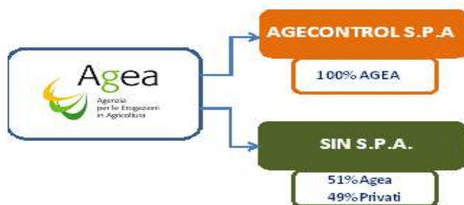
Figura 2 - Le partecipazioni di AGEA 2020

Come già rilevato, tale assetto è stato modificato in maniera sostanziale dal decreto legislativo n. 74 del 2018, come successivamente modificato e integrato dal decreto legislativo n. 116 del 2019.