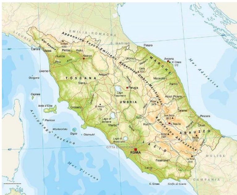
Fig. 3 – Estratto di carta fisica dell'Italia Centrale – Monte Amiata.