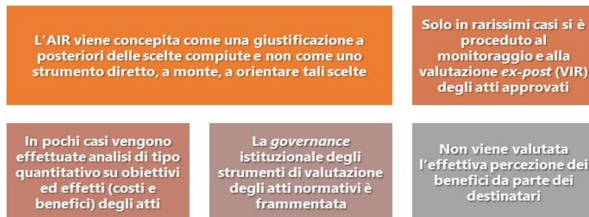
Figura 4. Gli strumenti della valutazione: in pratica

Negli ultimi anni c'è stato un complessivo miglioramento della qualità delle analisi prodotte, grazie alla costante azione di monitoraggio e verifica effettuata dal DAGL e alle attività di formazione svolte dalla Scuola Nazionale dell'Amministrazione (SNA).