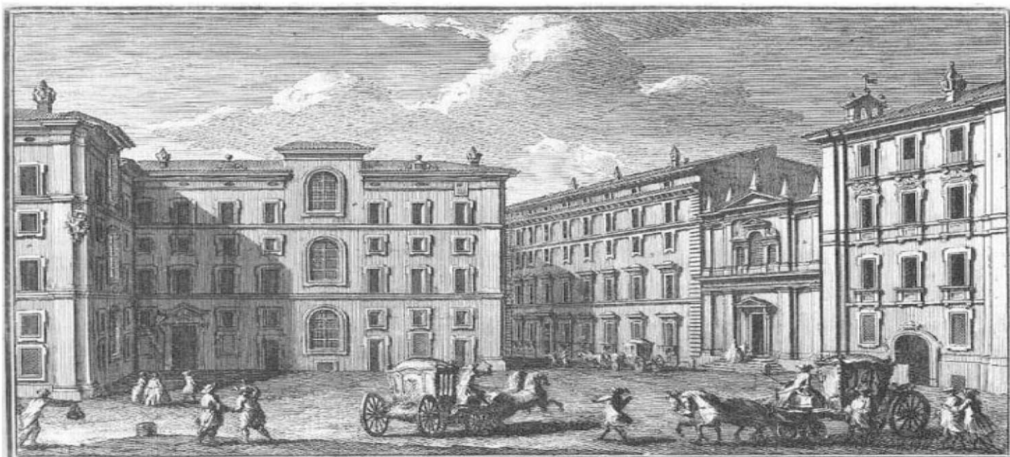
Seminario Romano s. Caracalla, che corrisponde sulla piazza di S. Ignazio, a Chiesa di S. Maria e Prospetto del Seminario Romano a Part. del Convento del PP. Domenicani